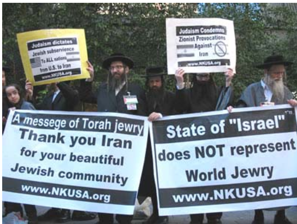
Judíos que agradecen a Irán su bella comunidad judía.

El anuncio fue recibido con desprecio por parte de la Asociación de Judíos Iraníes que hizo pública una declaración afirmando que su identidad nacional no estaba en venta. “La identidad de los judíos iraníes no es canjeable por ninguna suma de dinero. Los judíos iraníes son de los iraníes más antiguos. Los judíos de Irán están contentos con su identidad y su cultura, de manera que las amenazas y estas inmaduras tentaciones políticas no van a conseguir su objetivo de erradicar su identidad como judíos iraníes” (22).