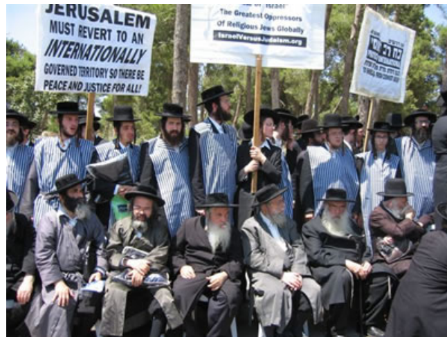
Manifestación de judíos contra el sionismo.

Así que no será sorprendente en el futuro ver cómo los judíos de Irán, que viven allí tranquilamente, empiezan a sufrir atentados para estimular su repatriación, y que serán una excusa más para demonizar y atacar a Irán, aunque hayan sido ejecutados por Israel.