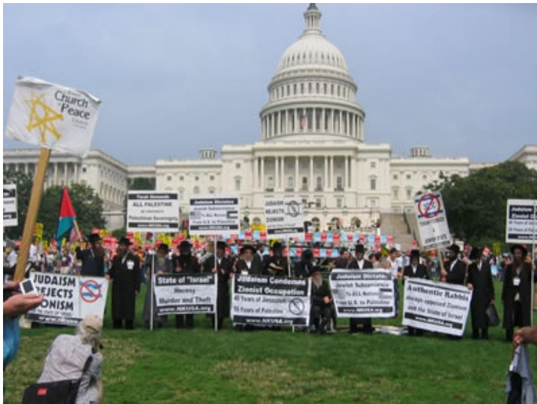
Manifestación de judíos antisionistas frente al Capitolio.

Algo en lo que concuerda por cierto con muchos judíos. Como oportunamente recuerdan las manifestaciones de los rabinos judíos contra el sionismo.