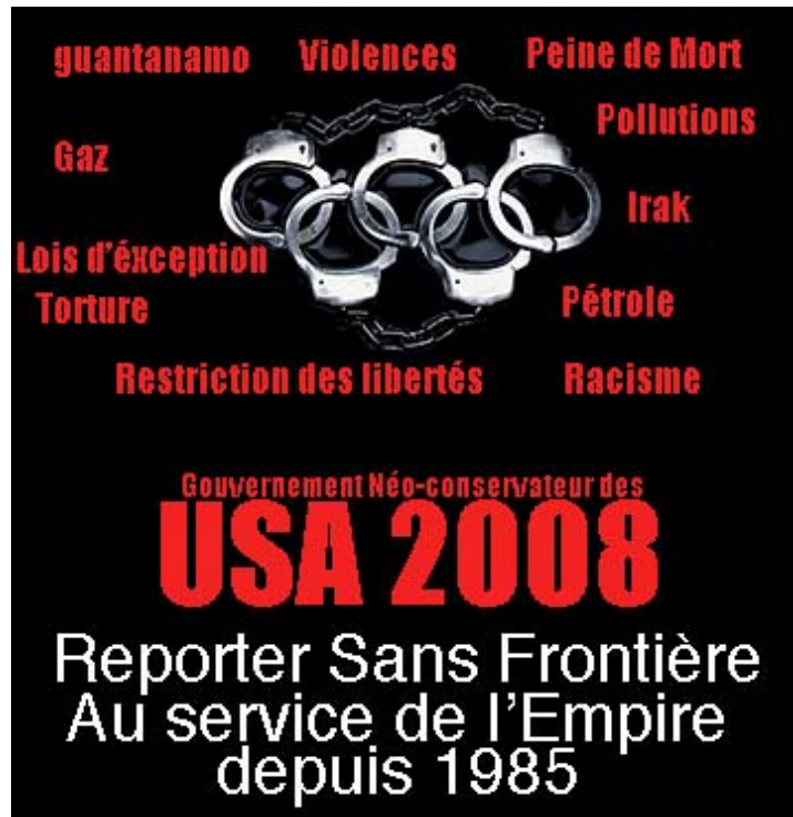
El gobierno USA 2008. Reporteros sin fronteras al servicio del imperio desde 1985.

Como explica acertadamente Jean Bricmont: