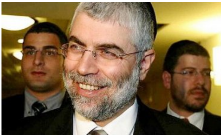
Shlomo Benizri, el revolucionario de la geología.

Y no creas que lo dijo durante una borrachera. Lo dijo el 20 de febrero de 2008, ante el parlamento israelí, con total apoyo de su partido, que es el tercero del país.