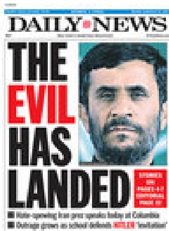
El maligno ha llegado.

Un paso previo para atacarlo, imprescindible para fabricar el consenso, es hacer que el crimen sea tolerable a los ojos de la población. Su objetivo es seguir preparando el terreno de la opinión pública para hacer aceptable el ataque nuclear que sigue posponiéndose, pero que no está descartado.