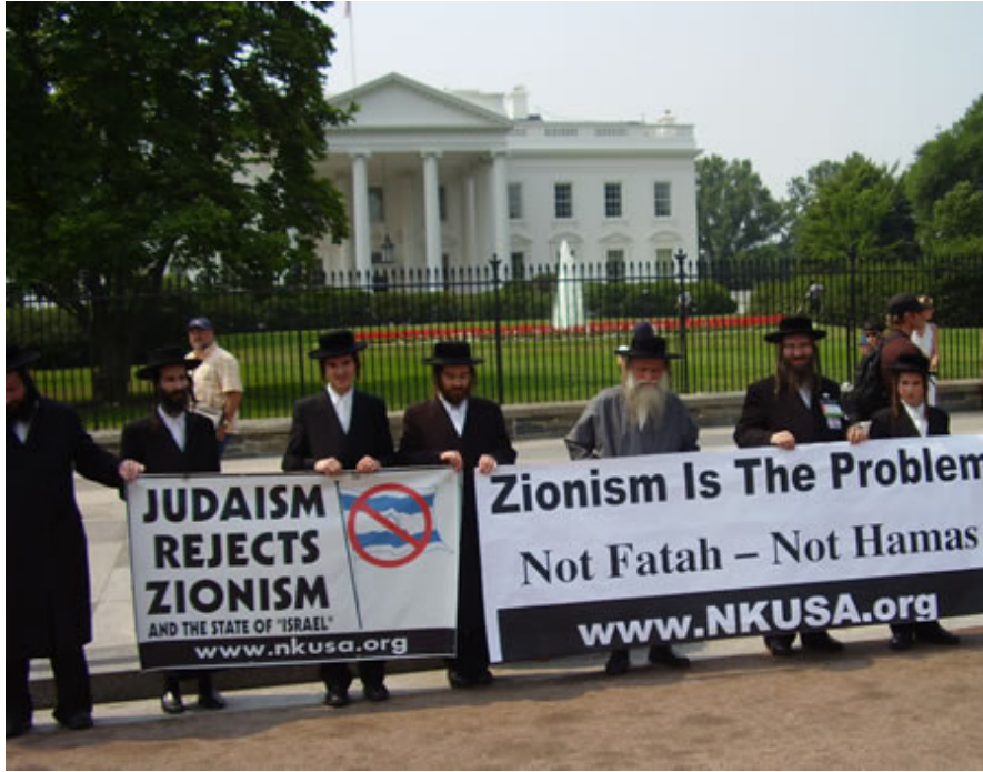
Manifestación de judíos antisionistas frente a la Casa Blanca.

En septiembre, en New York, a la pregunta de si él mismo o su gobierno albergan intenciones de acabar con Israel, en calidad de estado judío, el presidente de Irán Ahmadineyad respondió: “Nosotros amamos a todos los pueblos. Somos amigos de todos los judíos. En Irán son muchos los judíos que viven seguros y en paz. Tienen ustedes que tener en cuenta que de acuerdo a nuestra constitución y a nuestras leyes, se elige un diputado para el Parlamento por cada 150.000 habitantes, y, sin embargo, los judíos, cuya población no sobrepasa en Irán un quinto de esa cifra, tienen un representante en la cámara baja” (21).