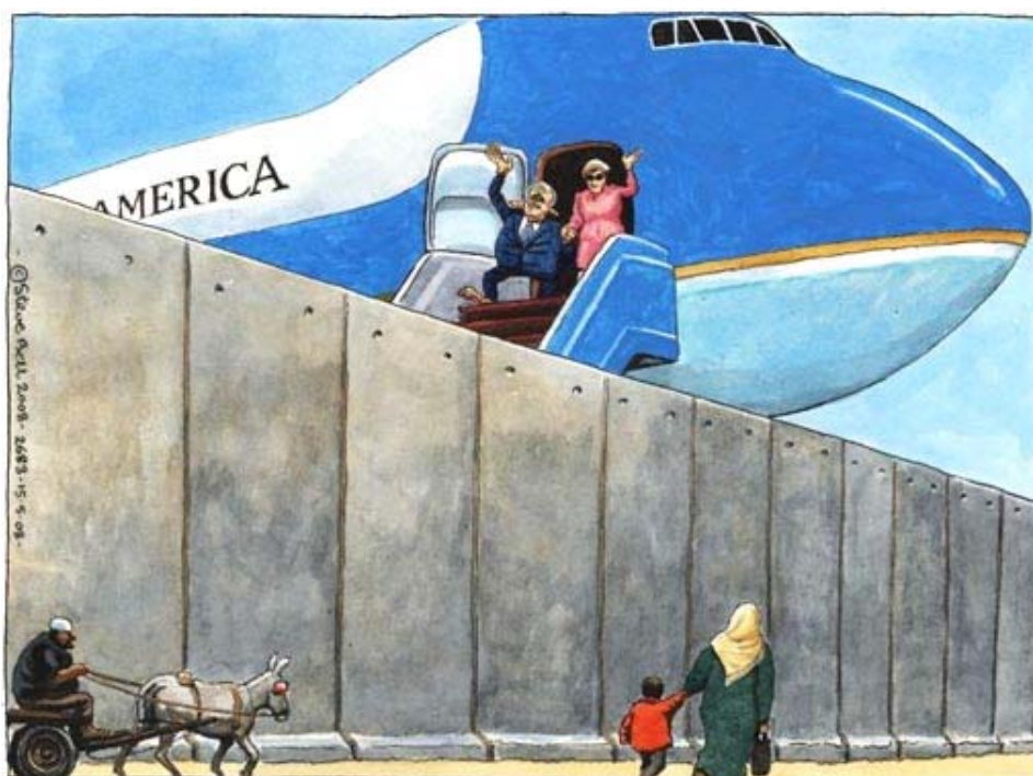
Bush en Israel

Antes de partir de Israel en su reciente gira de mayo para conmemorar el sexagésimo aniversario del país, Bush habló sobre Irán y dijo: "El mensaje para Irán es que su deseo de tener un arma nuclear, sumado a sus declaraciones sobre la destrucción de nuestro aliado cercano (Israel), nos ha dejado muy en claro a todos que debemos trabajar juntos para impedir que tengan un arma nuclear. Para mí la mayor amenaza para la paz en el Medio Oriente es el régimen iraní" (3).