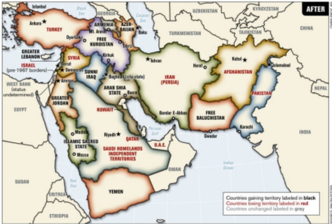
División programada de Iraq en el mapa de Peter explicado en Boletín134: Remodelación de Oriente Medio según USA.