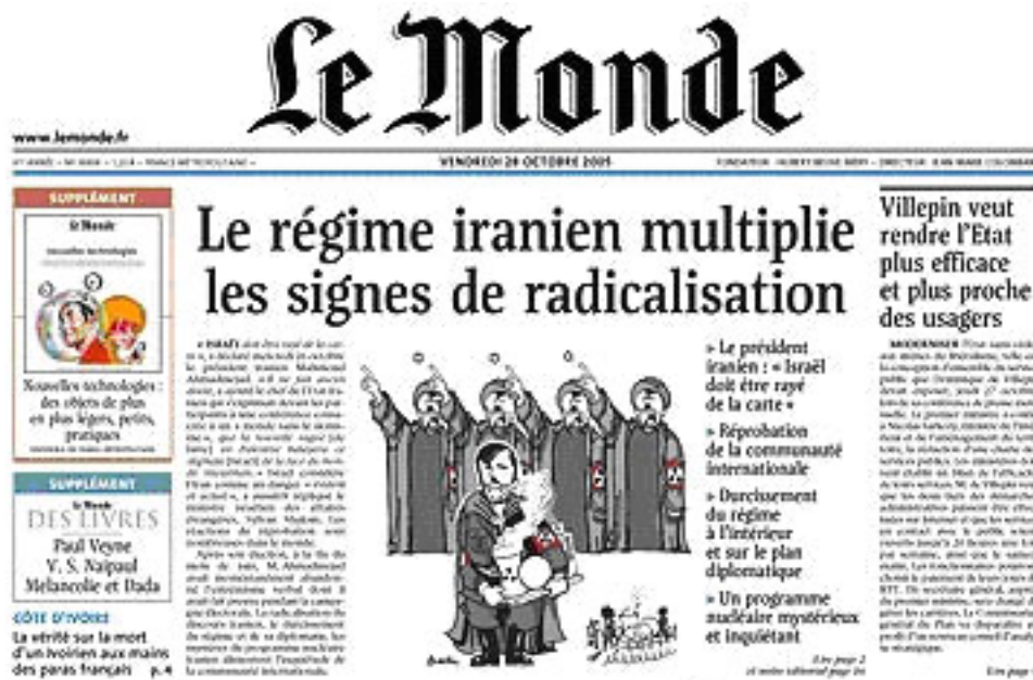
El régimen iraní caricaturizado como amenaza nazi, pero además nuclear.

Según el periódico Ha'aretz, responsables israelíes presentaron a Bush durante su visita a Israel en mayo, datos que contradicen el informe del NIE elaborado por 16 agencias de inteligencia estadounidenses (4).