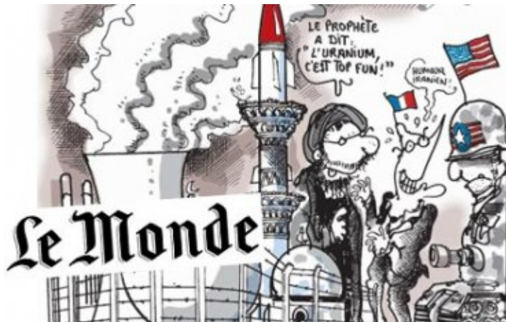
El profeta ha dicho que el uranio es lo más divertido.

El gobierno USA ha prometido el año pasado ayudar al programa nuclear indio y en mayo de 2008 proporcionar uranio enriquecido a Arabia Saudí. El activista antinuclear Harvey Wasserman dijo: “La idea de proporcionarle uranio enriquecido a los sauditas mientras se amenaza con declarar la guerra a los iraníes por enriquecer uranio es increíble” (7).