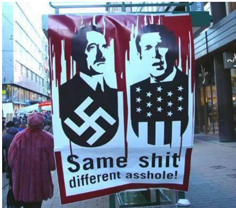
Misma mierda, ano diferente.

"Todas las señales ideológicas para atacar Irán están en su lugar. El país se ha demonizado a fondo porque no es agradable para las mujeres, los gays, o para los judíos. Eso en sí mismo es suficiente para neutralizar una gran parte de los norteamericanos de " izquierda ". La cuestión, naturalmente, no es si Irán es agradable o no (de acuerdo con nuestros puntos de vista), pero si hay alguna razón legal para atacarlo, y no hay ninguna, pero la ideología dominante de los derechos humanos ha legitimado, sobre todo en la izquierda, el derecho de intervención por motivos humanitarios en cualquier lugar, en cualquier momento. Esta ideología ha logrado apartar totalmente la cuestión "menor" del derecho internacional" (48)