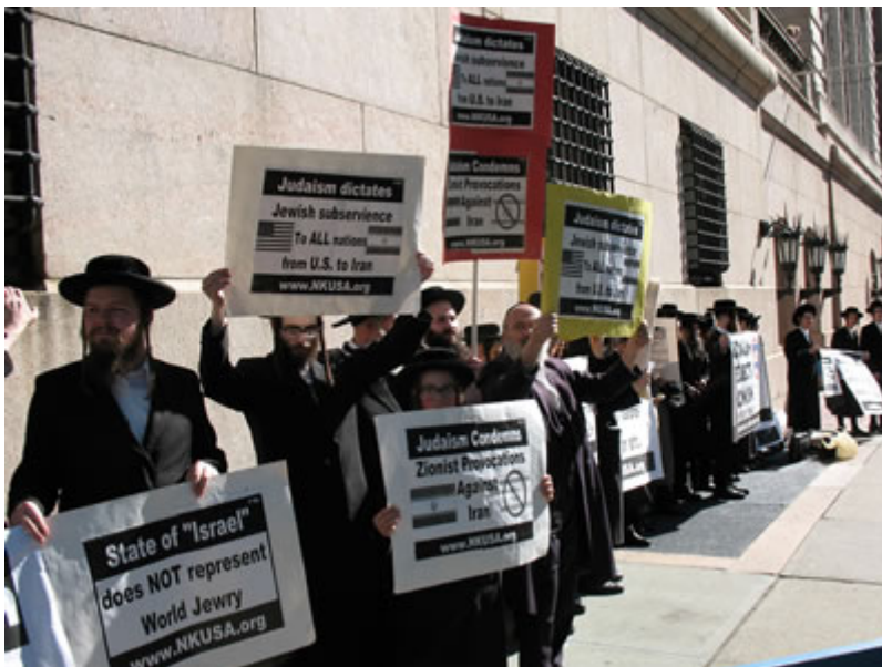
Manifestación de judíos contra el sionismo.

Otra campaña de intoxicación mediática que se reveló como algo demostradamente falso desde todos los puntos de vista que ya tratamos anteriormente (1).