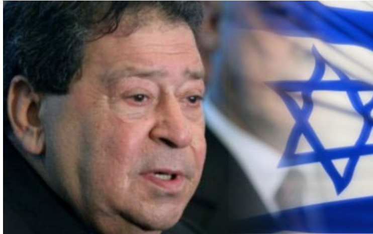
El ministro israelí Ben Eliezer.

Por cierto que tampoco ha habido destrozos de vestimentas cuando el ex Primer Ministro israelí Benjamin Netanyahu afirmó que los atentados del 11 de septiembre han sido buenos para Israel: “Nos estamos beneficiando de una cosa: los atentados a las Torres Gemelas y el Pentágono, y la lucha estadounidense en Iraq ... volcaron la opinión pública estadounidense a nuestro favor” . Netanyahu realizó los comentarios durante una conferencia en la universidad Bar Illan según el periódico israelí Ma'ariv (26).