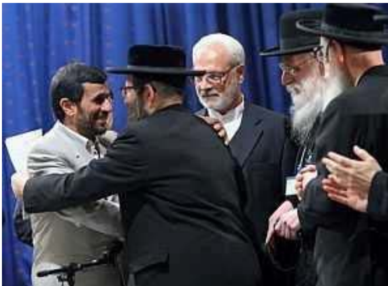
El presidente de Irán saludado por los rabinos judíos.

En septiembre, en New York, a la pregunta de si él mismo o su gobierno albergan intenciones de acabar con Israel, en calidad de estado judío, el presidente de Irán Ahmadineyad respondió: “Nosotros amamos a todos los pueblos. Somos amigos de todos los judíos. En Irán son muchos los judíos que viven seguros y en paz. Tienen ustedes que tener en cuenta que de acuerdo a nuestra constitución y a nuestras leyes, se elige un diputado para el Parlamento por cada 150.000 habitantes, y, sin embargo, los judíos, cuya población no sobrepasa en Irán un quinto de esa cifra, tienen un representante en la cámara baja” (21).