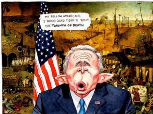
"Mi morralla americana os traigo encantado el triunfo de la muerte".

Pero el mayor "espónsor" del terrorismo mundial (incluyendo el islámico) ha sido y sigue siendo el gobierno de los Estados Unidos.