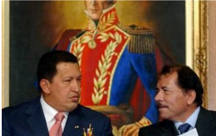
Chávez y Ortega.

Los presidentes de Venezuela y de Nicaragua han denunciado que el imperio norteamericano está creando las condiciones para generar un conflicto armado entre Colombia y Venezuela a partir del territorio colombiano militarmente ocupado para destruir los crecientes focos de descontento y de disidencia en América Latina.