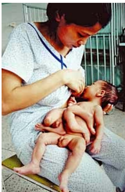
Niño vietnamita malformado.

La reciente decisión de la corte de apelación de Nueva York contra las víctimas vietnamitas del Agente Naranja no reconoce ninguna responsabilidad US a las multinacionales que lo fabricaron : Monsanto, DuPont, Dow Chemical, etc.