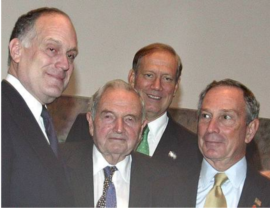
David Rockefeller (en el centro) uno de los principales apóstoles de la eugenesia con otros representantes de la "raza pura".

El proyecto no es completamente nuevo ya que existen otras cámaras de semillas repartidas por todo el mundo que albergan casi todas las existentes. Es lícito preguntarse porqué crear ahora otra centralizada.