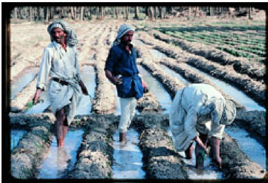
agricultores en Irak.

Estas compañías además son responsables de estar utilizando los alimentos como arma alimenticia contribuyendo al empobrecimiento de la mayoría de la población. Un caso especialmente escandaloso es el de Irak como hemos denunciado anteriormente. (6)