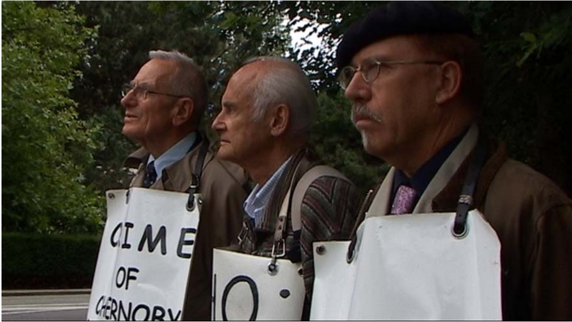
En la foto de izquierda a derecha: