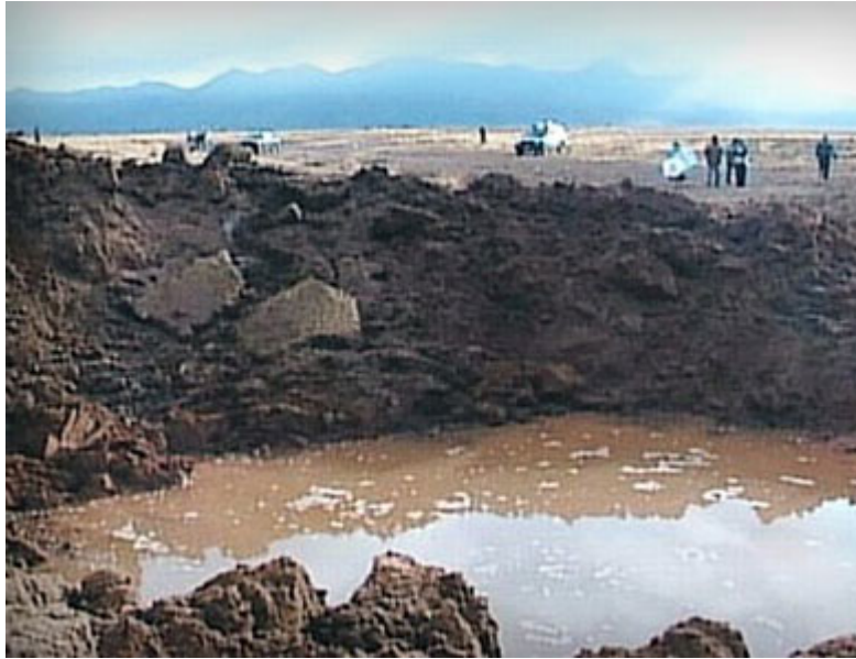
Foto: Cráter en Puno, Perú.

Más interesante todavía es que afirman que los propios militares estadounidenses habrían destruido su propio satélite de espionaje. En concreto habría sido derribado por la «United Space Air Forces' 30th Space Wing» estacionada en la base de Vandenberg en California.