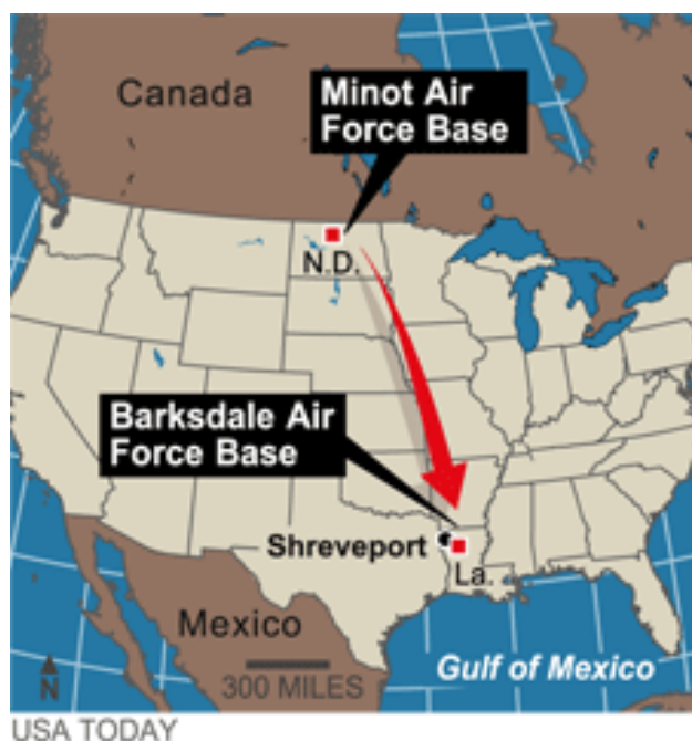
Foto: trayecto del B52 armado

Recordemos que seis misiles Cruise de carga nuclear fueron desplazados sin autorización de los depósitos custodiados y de alta seguridad de la base de Minot Air Force Base», en el estado de North Dakota, armados en un avión hasta la base aérea de Barksdale en Luisiana y en donde permanecieron 10 horas sin vigilancia.