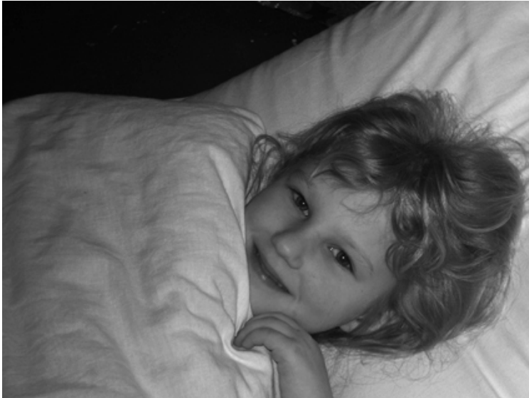
Foto: niña bielorrusa.