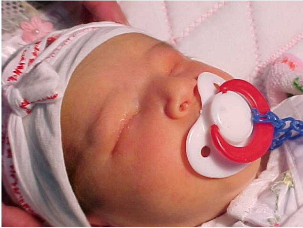
Foto: Anoftalmos 1