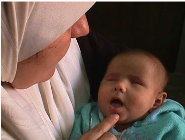
Foto: Anoftalmos 2