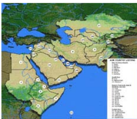
Foto: área de acción del CENTCOM.

Otro hecho importante en el avance hacia la guerra es que a principios del año 2007 la dirección de las fuerzas de marines fue transferida de Virginia a Bahrain (89, 90).