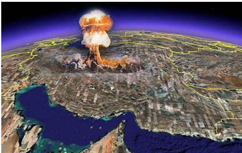
Foto: fotomontaje del ataque nuclear a Irán.