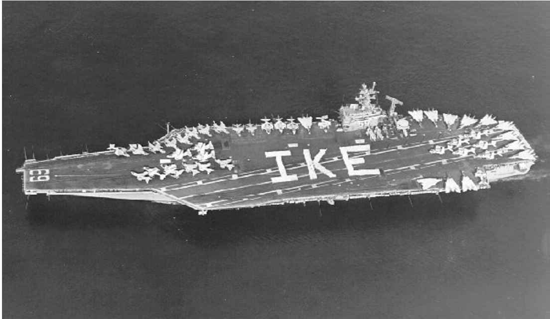
Foto: portaviones Dwight D. Eisenhower alias IKE.

El Dwight D. Eisenhower (que suele transportar hasta 80 cazabombarderos) lleva meses emplazado (78).