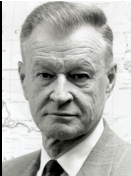
National Security Advisor Zbigniew Brzezinski