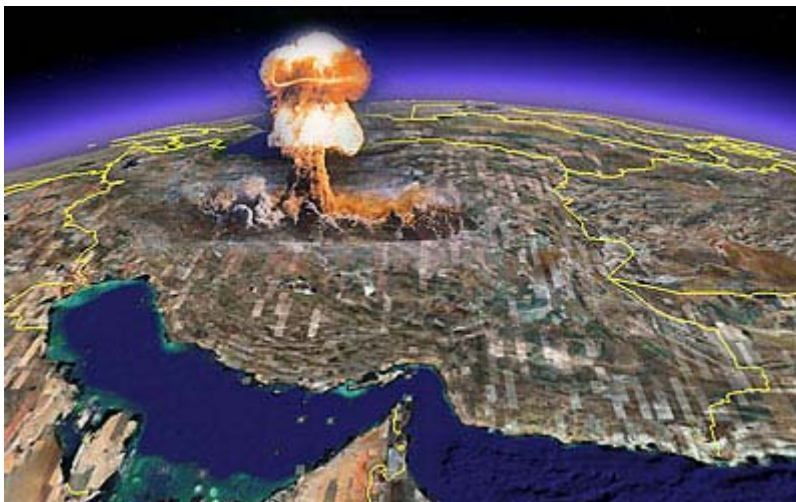
Foto: fotomontaje del ataque nuclear a Irán.