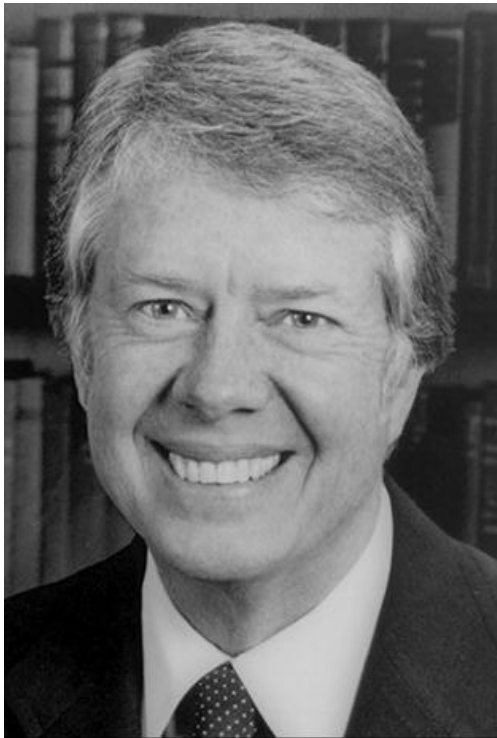
Pres. Jimmy Carter