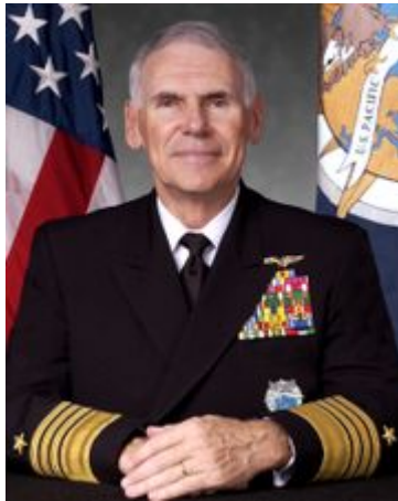
Foto: Almirante William J. Fallon

Hay varios hechos relacionados con el despliegue que indican que los planes de guerra siguen.