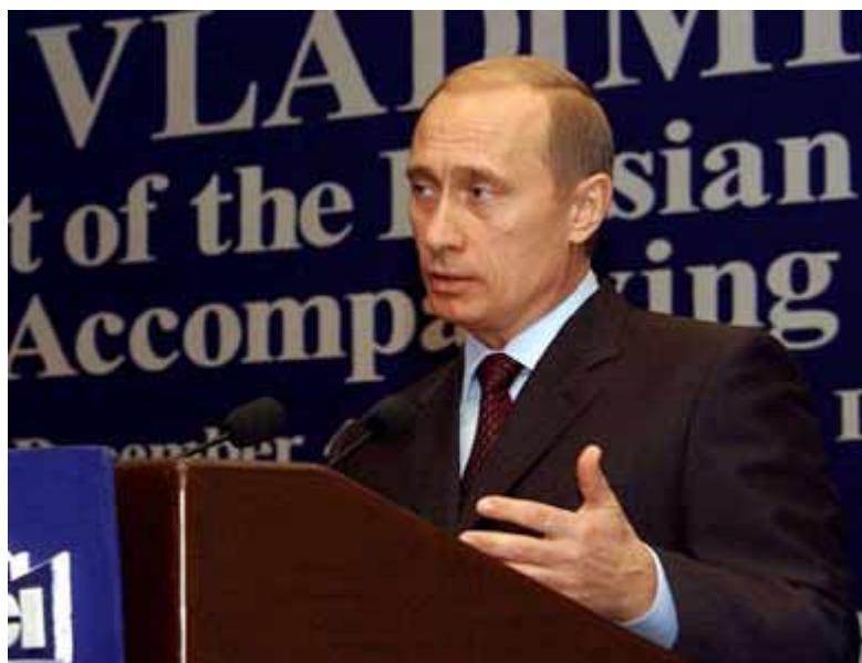
Foto: El presidente ruso Putin.

Putín insistió también en que los misiles iraníes (vendidos por otros países) no amenazan a Europa como se está diciendo, ya que tienen un alcance de solo 1,600-1,700 km (71).