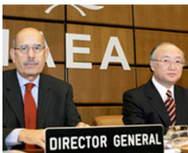
Foto: el director del Organismo Internacional de Energía Atómica, Mohamed El Baradei.

Un argumento que pretende ignorar que el Islam ha condenado no solo la utilización sino también la detención de armas nucleares (1).