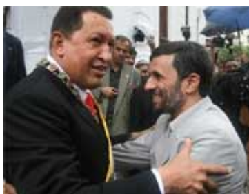
Foto: los presidentes de Irán y Venezuela.

"Hemos entregado a Irán los complejos de defensa antiaérea de alcance medio Tor M-1", declaró el viceprimer ministro ruso y titular de Defensa, Serguéi Ivanov, subrayando que Irán "no se encuentra bajo sanciones internacionales, que le impidan importar armamento defensivo" (72, 73, 74).