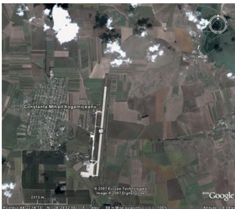
Foto: La base de Constanza en Rumanía.

Antes de finales de marzo, está previsto que 3000 soldados US lleguen «por rotación» a las bases USA en Bulgaria. Según un acuerdo de cooperación militar USA-Bulgaria, firmado en abril 2006, una base aérea en Bezmer, un segundo terreno de aviación en Graf Ignitievo y un área de tiro en Novo Selo han sido alquiladas a EEUU (96).