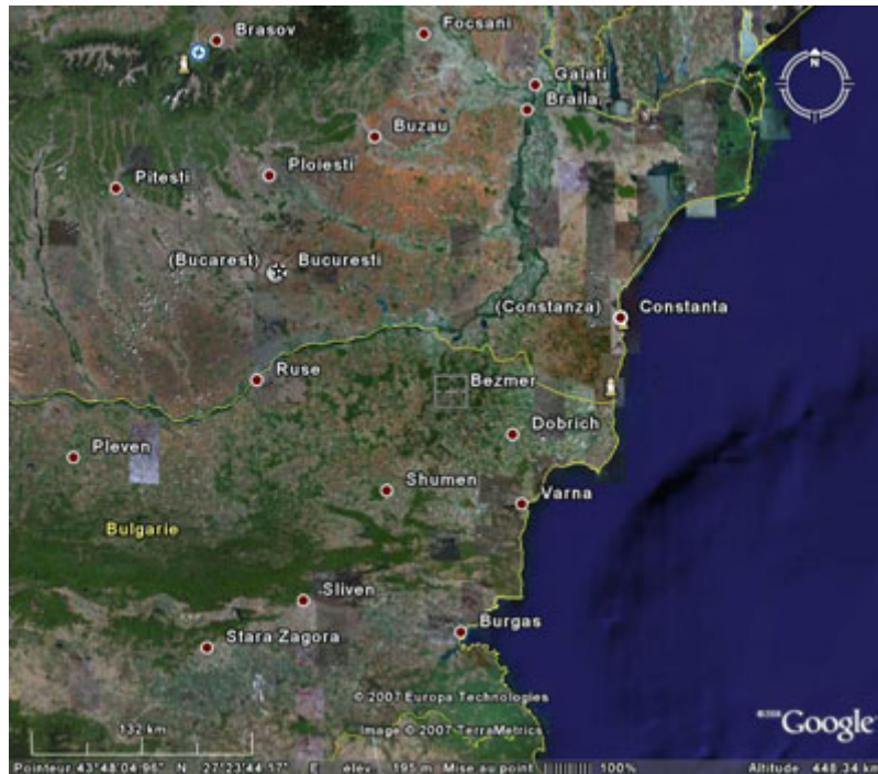
Foto: La costa de Constanza, Rumanía.