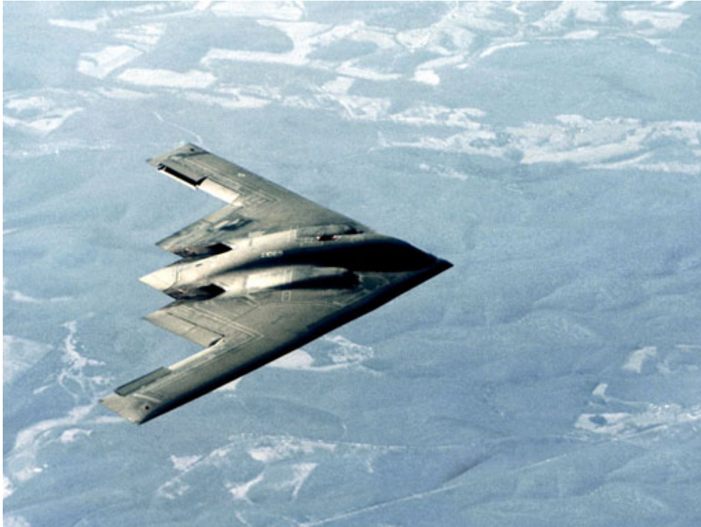
Foto: Bombardero B2.

El plan para atacar a Irán asume ahora que como mínimo 10.000 objetivos pueden ser alcanzados en un solo raid, con aviones de los portaviones y desde la base de Diego García.