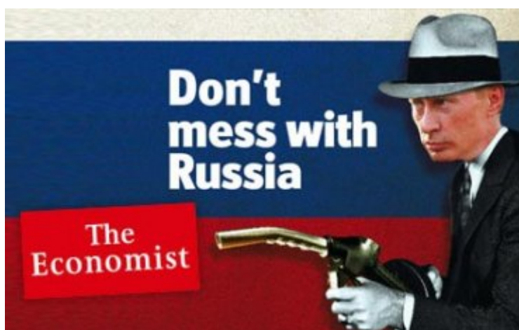
Foto: Portada de The Economist: fotomontaje, Putin disfrazado de Gangster nos amenaza con una manguera de petróleo.

La demonización de Rusia, que se opone al ataque a Irán, está ejemplificada por varios hechos recientes. El envenenamiento de un ex agente ruso con Polonio atribuido en los medios al gobierno Ruso (68), incluso por revistas "serias " como The economist, que atribuye al Kremlin el asesinato de Alexander Litvinenko (69).