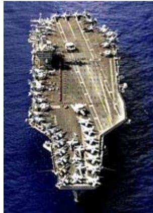
Foto: El portaviones Nimitz.

El Dwight D. Eisenhower (que suele transportar hasta 80 cazabombarderos) lleva meses emplazado (78).