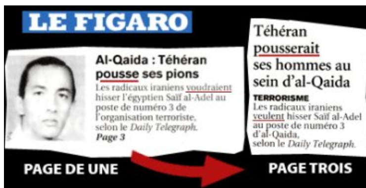
Al Qaeda, Irán empuja sus peones. Irán empuja a sus hombres en el seno de Al Qaeda.

El diario francés Le Figaro, que pertenece al grupo de comerciantes de armas galo D´assault, va más lejos y acusa a Irán de colocar a sus hombres en puestos claves de la organización Al Qaeda, sin pruebas.