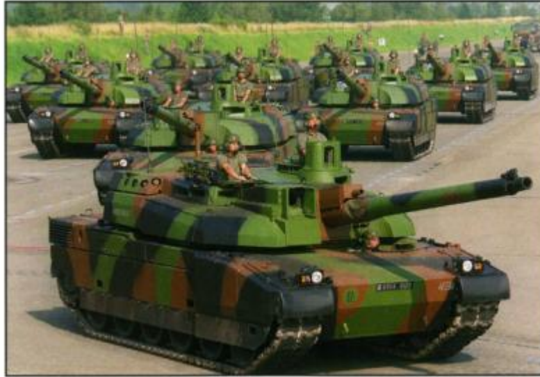
Tanque Leclerc, munición 120 mm., de UE Tanque AMX 30, munición 105 mm., de UE

Foto: Carros de combate franceses Leclerc.