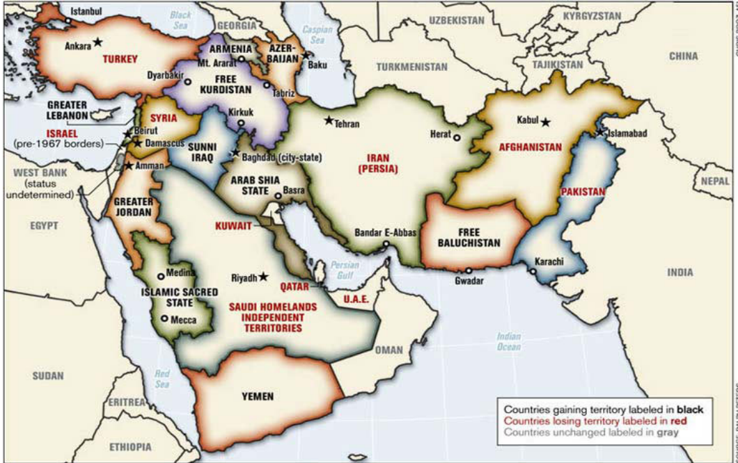
Ver imagen ampliada

Remodelación de Oriente Medio: Dividir Irak. Robar a Irán y a Siria. La autopista energética Baku-Tiflis-Ceyhan- Eilat. Despliegue naval en el Este del Mediterráneo. Los 4 frentes de la próxima guerra contra Siria e Irán. Despliegue naval creciente en el Golfo Pérsico.