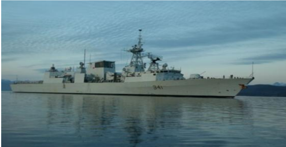
Foto: fragata de la armada canadiense, el H.M.C.S. Ottawa.

El Grupo Expedicionario de Ataque 5 (EST 5) ha realizado ejercicios anti-submarinos en el Pacifico antes de dirigirse al Golfo Pérsico con el H.M.C.S. Ottawa de Canadá y Guardacostas Norteamericanos.