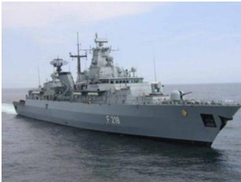
Foto: Fragata alemana Brandenburg en la costa del Líbano.

En septiembre 2006, Alemania se hizo cargo de la fuerza naval multinacional. Ha enviado 8 barcos incluyendo 2 fragatas, con más de 2,400 hombres bajo el mandato oficial de la UNIFIL.