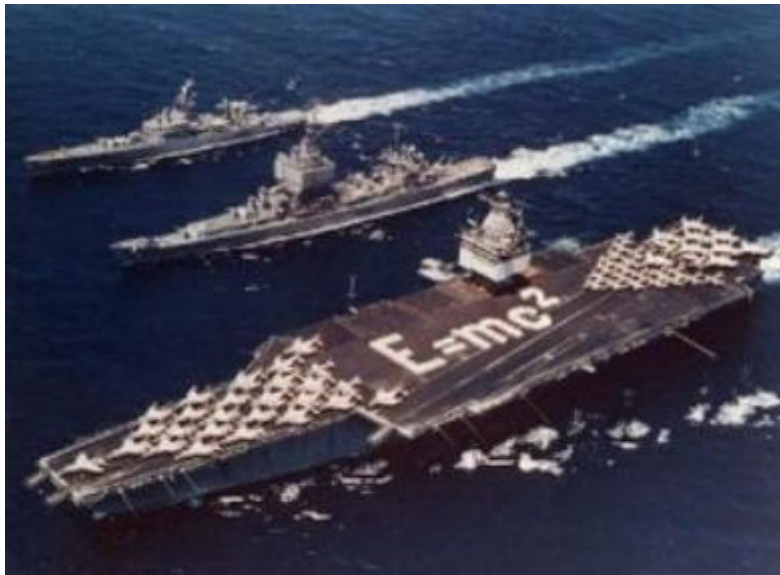
Foto: parte del grupo de combate Enterprise.

El terrorismo es una excusa perfecta en la que vale todo. Basta con fabricar chapuceramente algunas pruebas que supuestamente ligan a un país (previamente demonizado) con el terrorismo inventado para justificar bombardearlo con armas radiactivas como hemos podido comprobar en Irak y Afganistán.